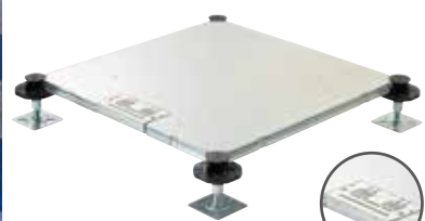
WSB500Nみなとモデル フタ形状